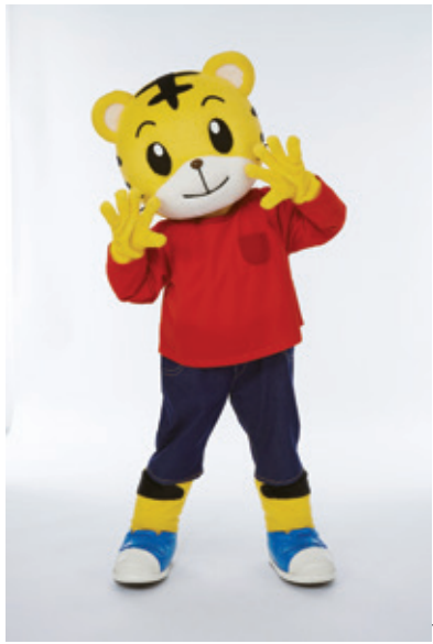
しまじろう